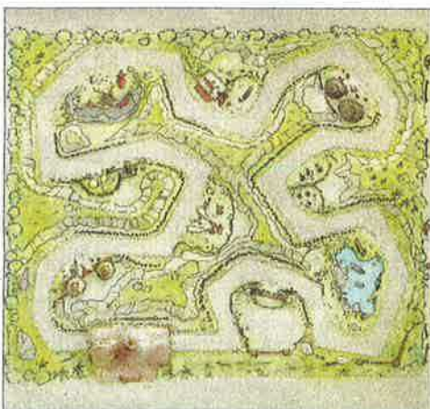
Le plan du parcours scénique « Aventures Africaines »

Des montagnes russes, des attractions numériques 3D ou Outdoor... il y en aura pour tous les goûts. En tout, 14 attractions seront présentées dès le lancement du site, 25 au total après les extensions prévues