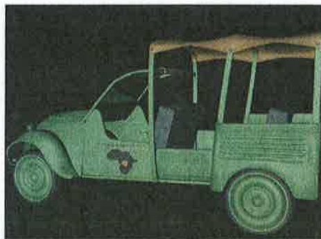
Des véhicules inspirés de l'album « Le Gorille à bonne mine »